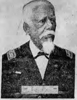
Gral. ELOY ALFARO

FUE AMERICA, Y NO SOLAMENTE ECUADOR, SU PATRIA. LA QUE CONMEMORO SU ADVENIMIENTO AL MUNDO